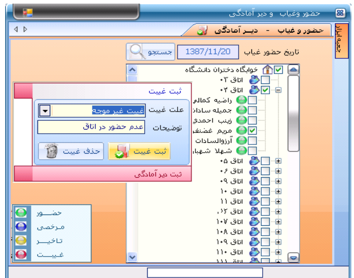
فرم حضور غیاب دستی