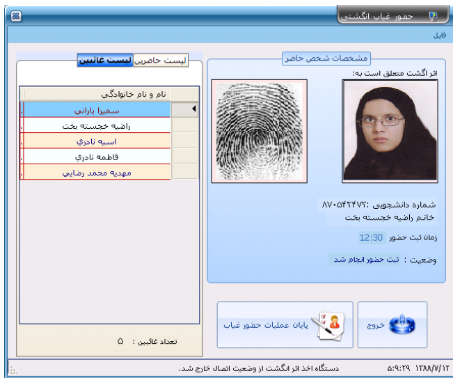
فرم حضور غیاب انگشتی